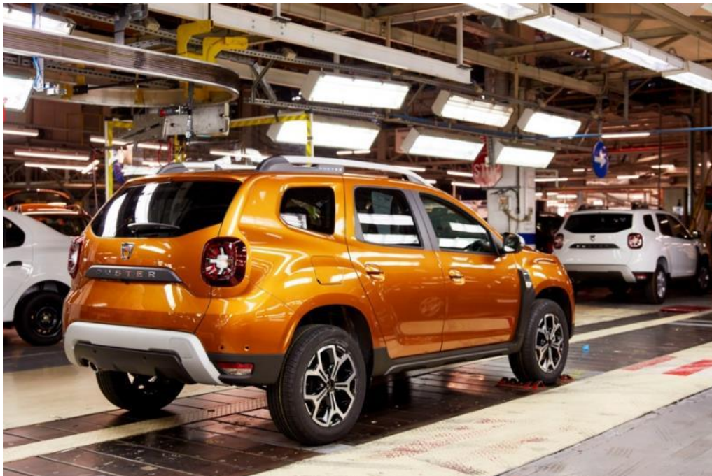
Duster se proizvodi u fabrici Mioveni od 2010.

Dizajneri i inženjeri dali su sve od sebe da bi stvorili tako jedinstveno vozilo, ali i proizvodni timovi su prihvatili izazov. Fabrika Mioveni u Pitestiju, smeštena 200 km od Bukurešta, je obnovljena i opremljena u okviru pripreme fabrike za proizvodnju Dustera: platforme unutar fabrike, prostorije za pripremu delova, AGV kolica, ergonomske radne jedinice prilagođene svakom procesu proizvodnje. U Rumuniji je Duster postao nacionalni ponos: policijski Duster, vojni Duster, bolnički Duster... Duster koriste razne vladine službe i velike kompanije.