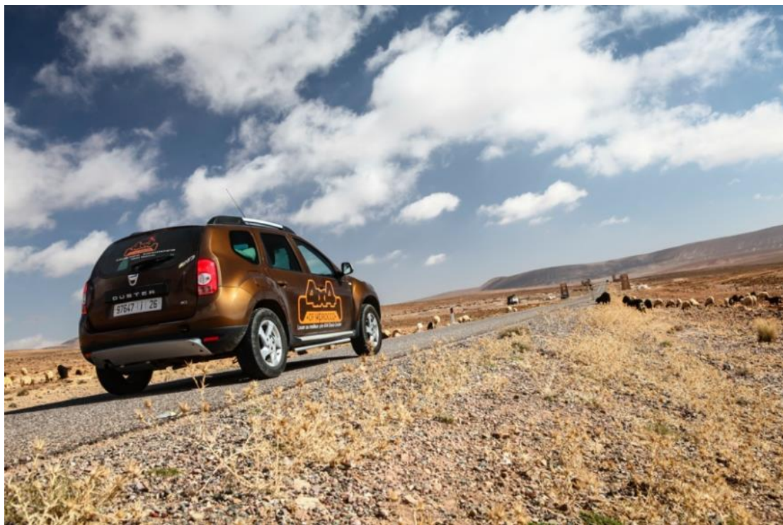
Duster na 4x4 takmičenju u Maroku