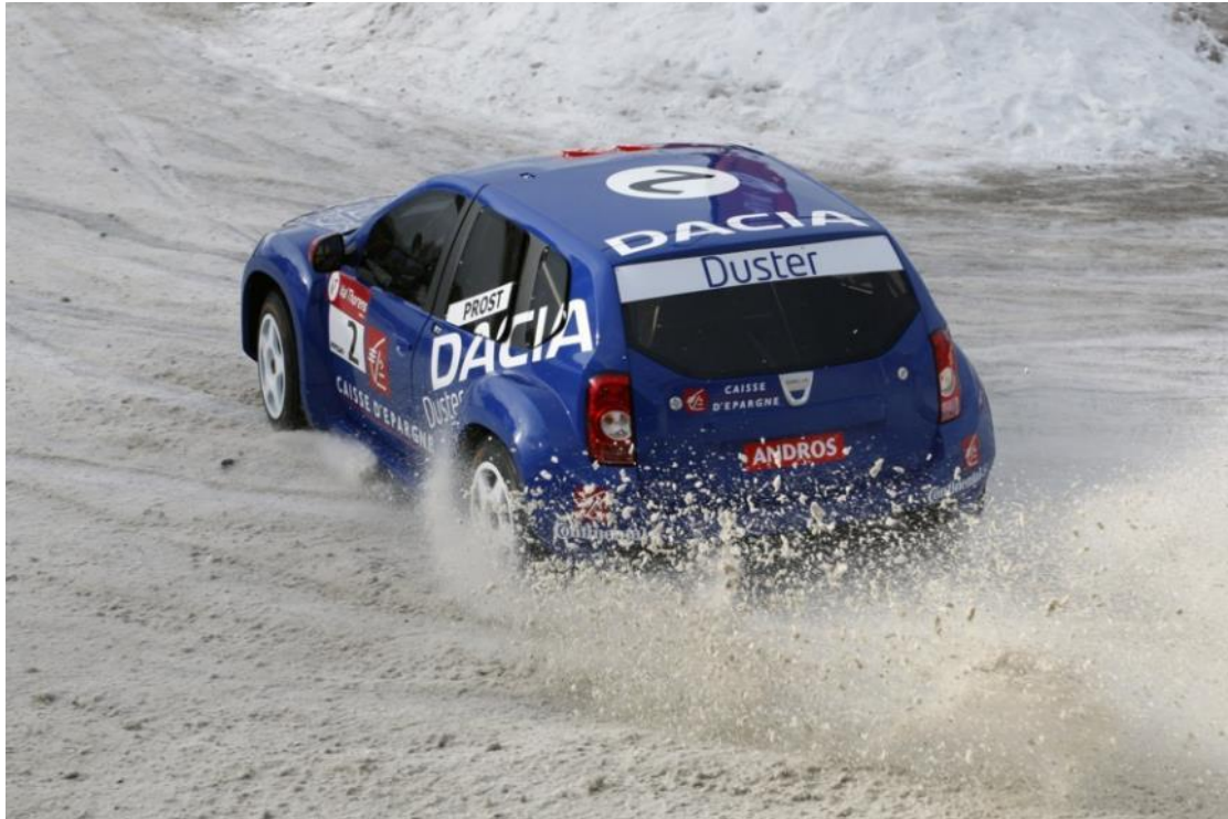
Dacia Duster na Andros Trophy