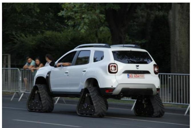
Policijski Duster u Rumuniji / Duster sa gusenicama - Photo credit Olivier DUHAUTOY, Daciattitude.