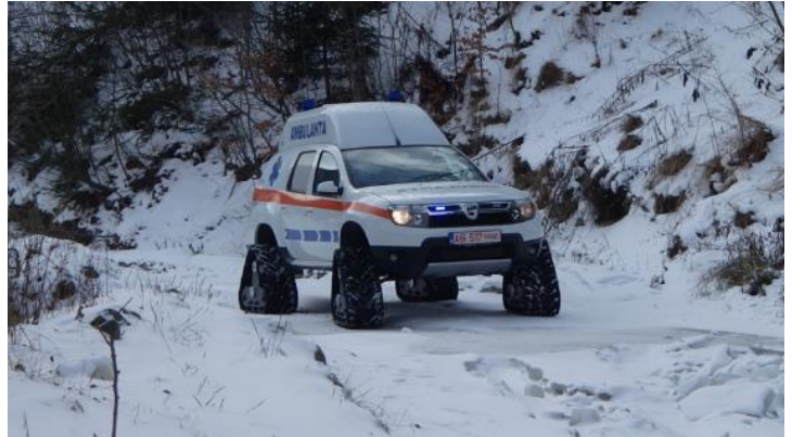
Duster posebno opremljen za Titi Vozačku akademiju u Rumuniji - Photo credit Olivier DUHAUTOY, Daciattitude / Ambulantni Duster posebno opremljen za teško dostupna područja