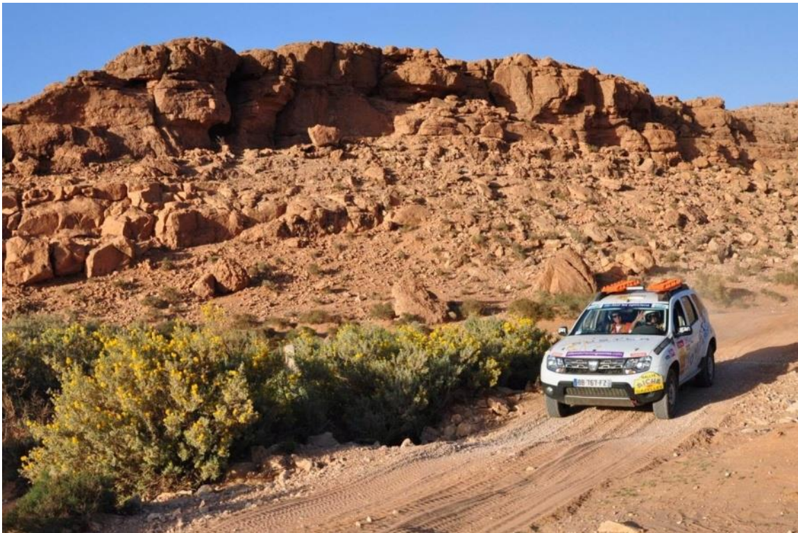
Women@Renault team voze Duster na Reliju Aïcha des Gazelles u južnom Maroku

• Počnimo sa njegovom sportskom, avanturističkom stranom. Duster voli zdravu konkurenciju i ne odustaje lako. Od Aïcha des Gazelles relija u Maroku do poznatog uspona na Pikes Peak u Sjedinjenim Državama i Trofeja Andros u Francuskoj, Duster voli izazove.