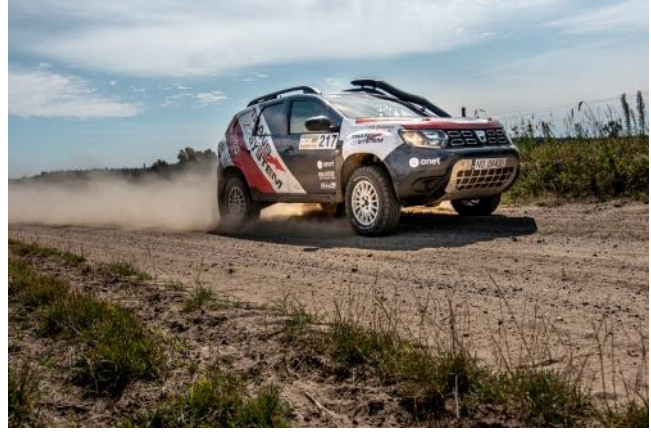
Ulazak Duster na off-road tamičenje u Poljskoj je postala tradicija