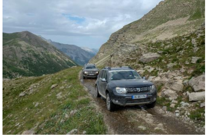
Duster voli pustolovine kao i njegovi vlasnici