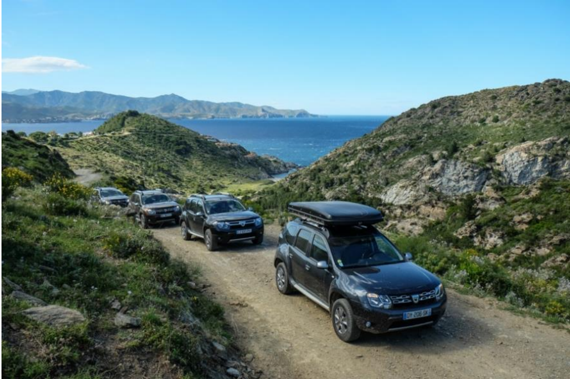
Duster u Grčkoj, dašak slobode

• A sada malo o posebnoj opremi i ograničenim serijama: Duster sa gusenicama, Duster vozilo hitne pomoći, Duster policijsko vozilo, Duster „Papamobil“... Duster može sve. Rumunsko Ministarstvo obrane je naručilo čak 880 Duster a za svoju flotu. Boja karoserije se za svakog od njih pažljivo pripremala u radionicama Mioveni.