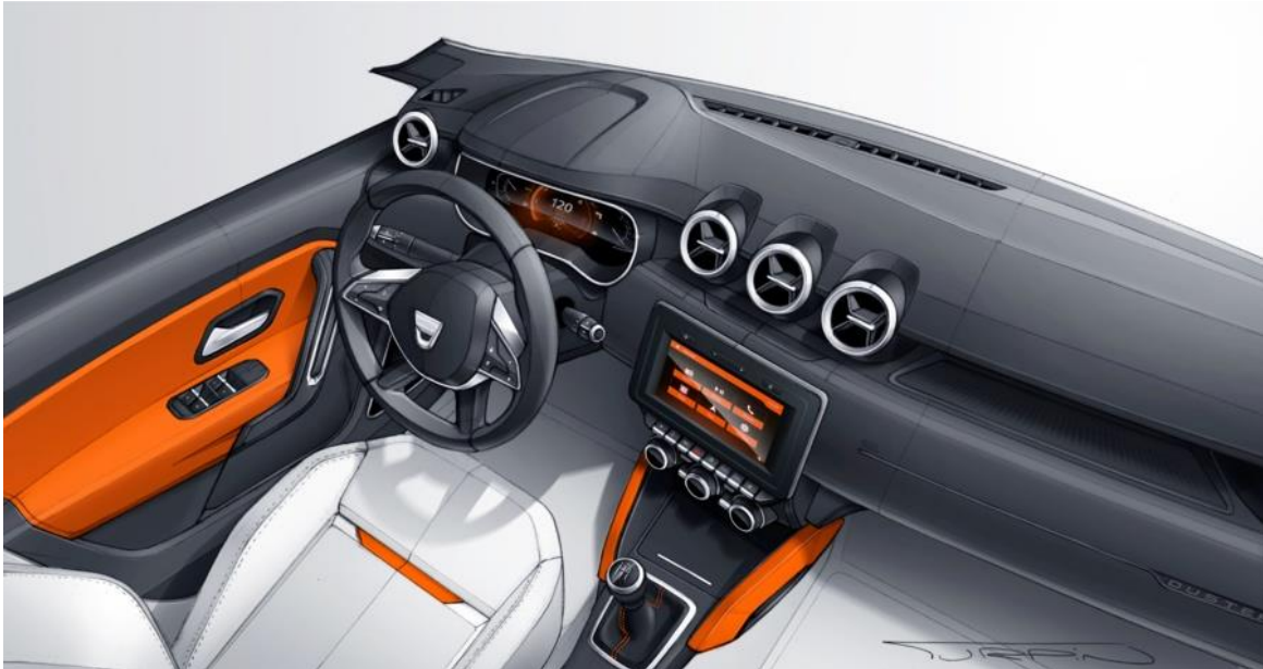
Tri usisnika vazduha za veću udobnost i unapredjeni izgled

Iskreno, postoji još jedna karakteristika koju dizajneri još nisu spomenuli. Duster 2 je jedini model marke Dacia koji se može pohvaliti sa ne dva, već tri usisnika vazduha smeštena na sredini kontrolne table. Kako neobično! Ali ipak, ova ideja nije pala s neba, već je bila vođena estetikom i udobnošću putnika.