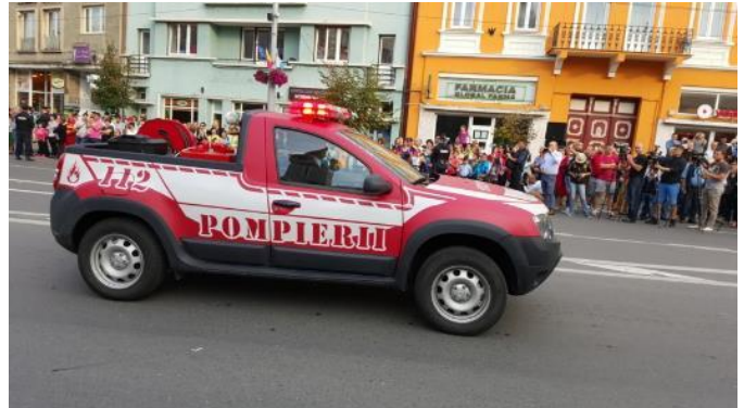
Za različite namene proizvedeno je i modifikovano više od 400 Duster Pick-upova

Pustolovine, priroda, putovanja... Duster nudi celu lepezu iskustava u kojima uživa već više od dva miliona kupaca!.