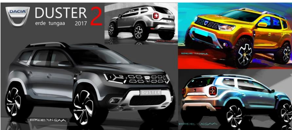
Muževniji dizajn za Duster 2

Prvi Duster je bio jako popularan, ali njegova nova verzija ga je nadmašila. Predstavljena je sedam godina kasnije, 2017., a uputstva dizajnerima su bila jedalistavna: zadržati izvorni DNK i nadograditi prethodni model. Nakon brojnih internih konkursa za dizajn i vrlo uzbudljivih skica, jedan dizajn se posebno istakao: mišićav izgled, povišena bočna linija sa višim bočnim prozorima i upečatljiva prednja rešetka.