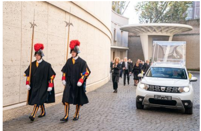
Više od 800 Duster a isporučeno je rumunskoj vojsci / Grupa Renault donirala je Dacia Duster 4WD Njegovoj Svetosti Papi Franji, a auto je posebno dizajniran da zadovolji Papine potrebe za prevozom