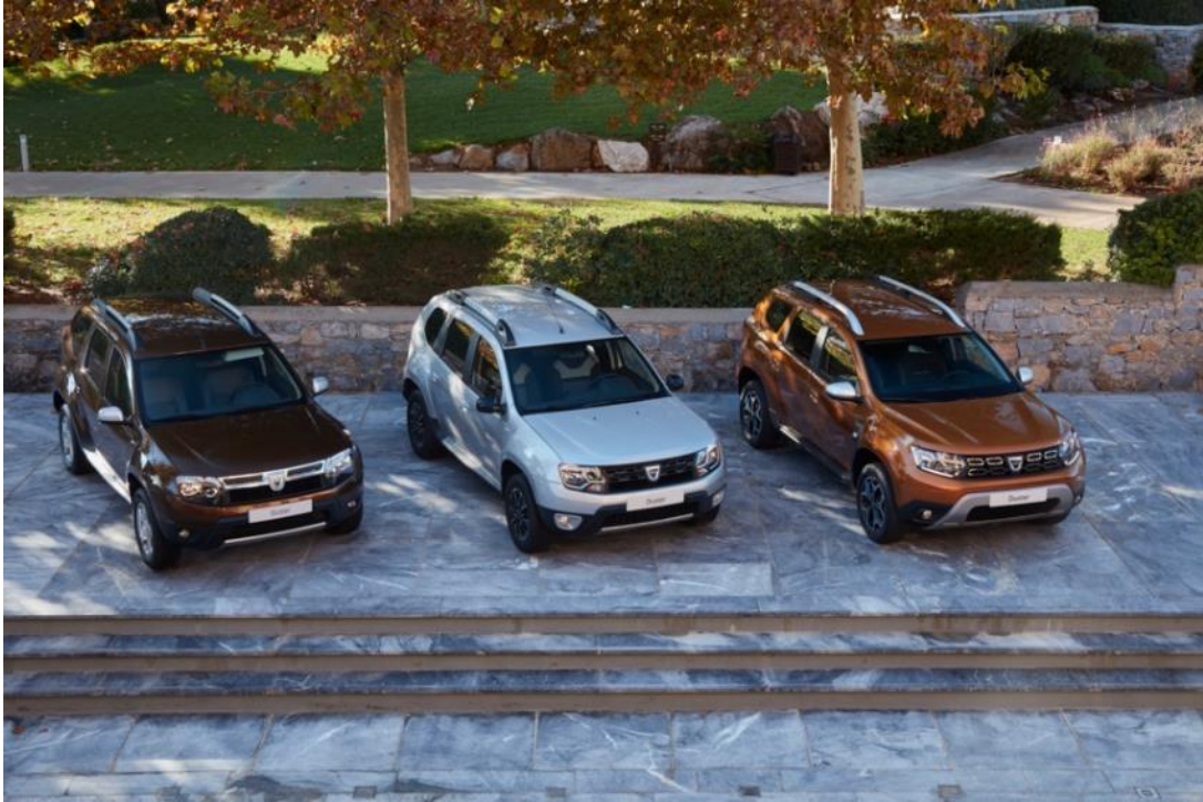
Dve uspešne generacije Duster

Postoji more anegdota o Dusterovom dizajnu, posebno s obzirom na veliku potrebu za pristupačnim i pouzdanim rešenjima kada se radi o inovacijama. To je deo načina optimizacije troškova dizajna marke Dacia. Opremite se disaljkom! Ovaj crni dodatak u kojem se nalazi svetlo upozorenja Duster čini prepoznatljivim. David Durand, voditelj Odeljenja za spoljašnji dizajn, je podelio sa nama priču o tome: „Morali smo da osmislimo dizajn prema tehničkom ograničenju. Točkovi su prilično izvučeni prema spolja u odalisu na vrata pa je nemoguće izrezati delove koji odgovaraju traženom obliku. Zbog toga smo napravili plastičnu „disaljku“ između blatobrana i vrata. Vrlo je funkcionalna jer pruža idealnu zaštitu od šljunka i blata. Uštedeli smo novac osmislivši jedinstveni dizajn koji Dusteru daje robustan izgled!“