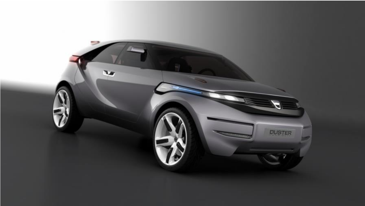
Konceptni auto Dacia Duster , predstavljen na Ženevskom sajmu automobila 2009.

Proces dizajna je bio jedna od mnogih prepreka: 6-stepeni menjač, pogon sa automatskim kvačilom, nagib osovina i još mnogo toga. Timovi se svega toga i dan danas sećaju. Pogotovo kada se radilo o ostvarispoljaju brzine pri polaganom kretanju u prvoj brzini - automobil je mogao da se kreće sa samo 5,79 km/h pri samo 1000 o/min. Vojnici su za vreme rata marširali uz džipove kako bi raščistili put, a Loïc Feuvray - direktor razvoja proizvoda Duster 1 - je sledio njihov primer: „Hodao bih uz automobil kako bih se uverio da smo postigli brzinu koja je dovoljno spora za terenac sa pogonom na sva četiri točka.“ Bio je to izazov koji su dizajneri očigledali savladali, što je dokazano bezbrojnim terenskim putospoljajima na koja su se uputili kupci Duster 1.